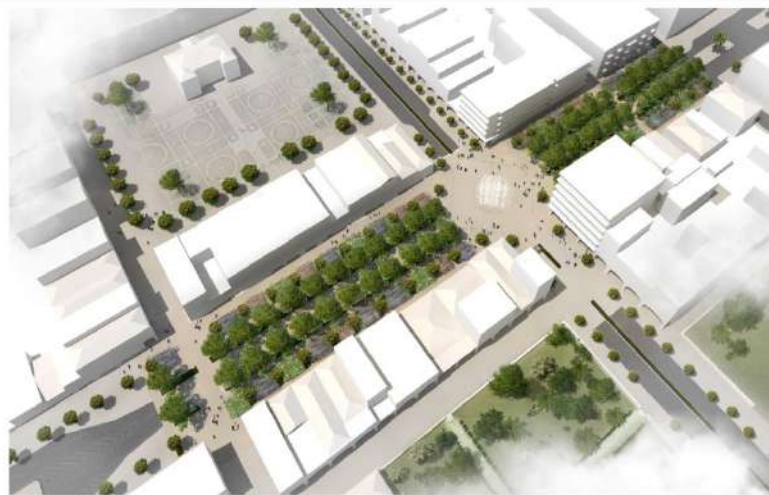
Η πρόταση ανάπλασης του κεντρικού τμήματος της Παλαιολόγου