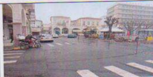
Η παρούσα κατάσταση στην πλατεία