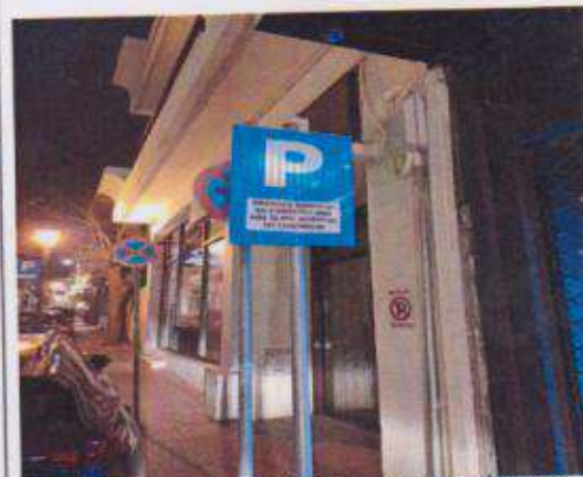
Παράδειγμα προτεινόμενης αντιμετώπισης του θέματος από άλλο δήμο της χώρας